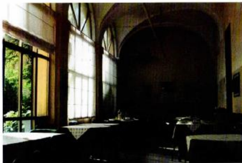
COMUNITÀ SILVANA BAY

Fra i suoi scopi, l'Anffas si pone l'obiettivo di operare nel campo dell'assistenza sociale, sanitaria, socio-educativa, della ricerca scientifica, della formazione e della tutela dei diritti civili a favore di persone con inabilità intellettiva e relazionale e delle loro famiglie.