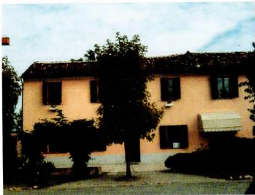
CENTRO PAOLO SIGNORINI

In base alle proprie esigenze, il cittadino ha diritto a usufruire di tali servizi, nel rispetto dei criteri di riservatezza e di imparzialità.